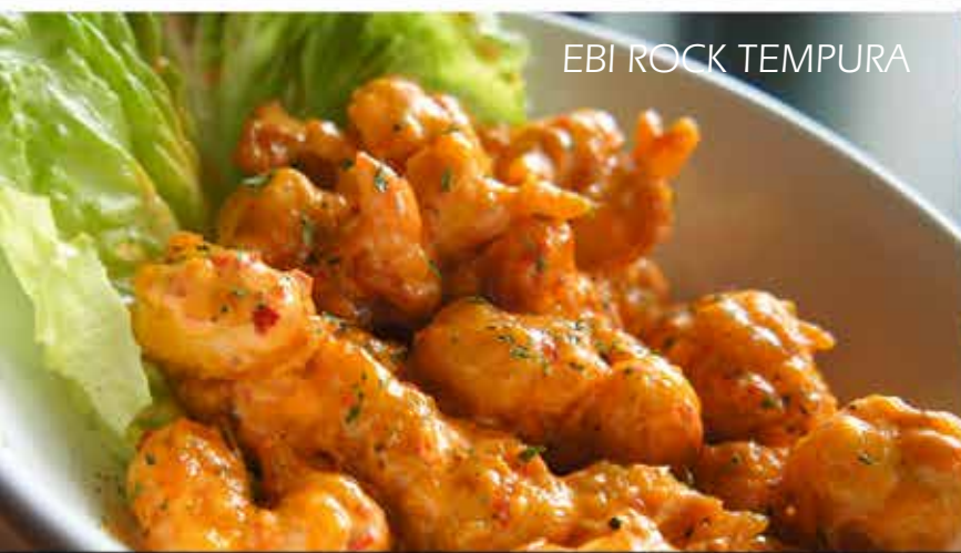
EBI ROCK TEMPURA