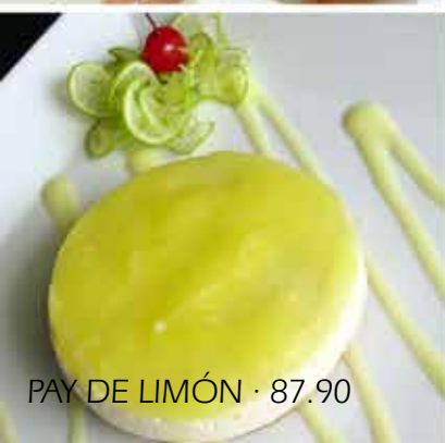
PAY DE LIMÓN · 87.90