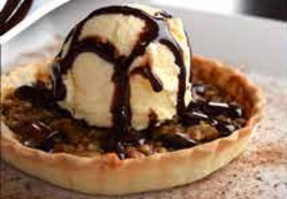
PAY DE NUEZ · 87.90