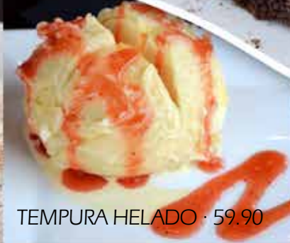
TEMPURA HELADO · 59.90