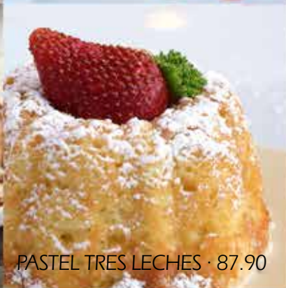
PASTEL TRES LECHEs · 87.90