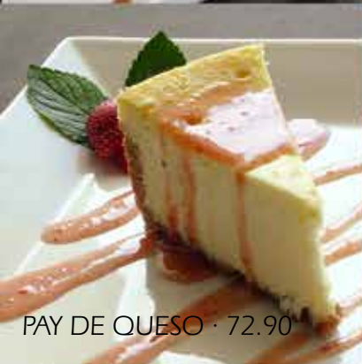
PAY DE QUESO · 72.90