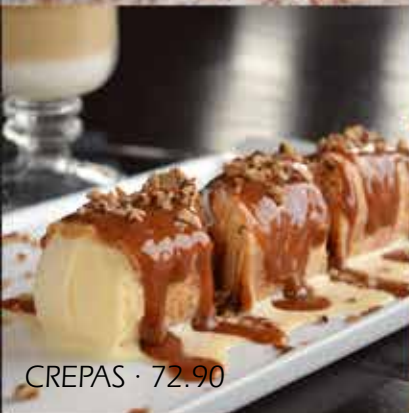
CREPAS · 72.90