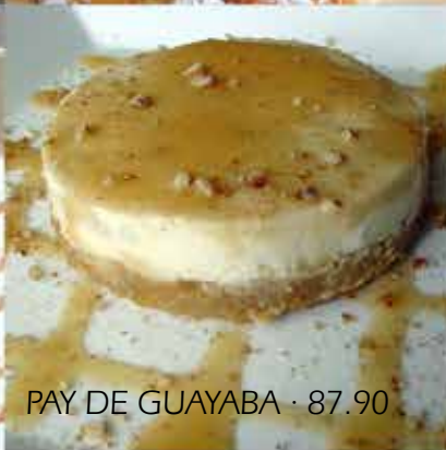
PAY DE GUAYABA · 87.90